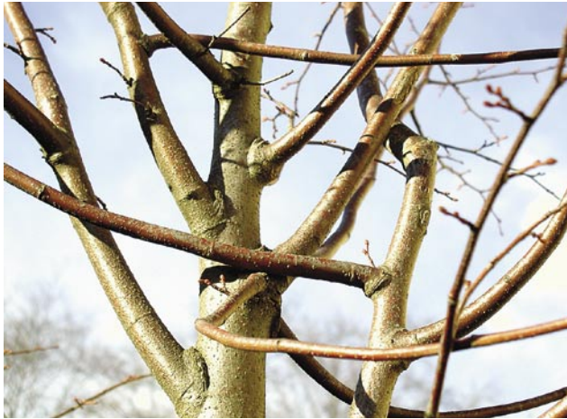
Reibende Äste: Hier ist fachgerechte Baumpflege erforderlich

Fachgerechter Kronenschnitt beseitigt unerwünschte Entwicklungen wie z.B. reibende Äste und fördert den Baum in seiner Entwicklung. Das Entfernen von stärkeren Ästen birgt immer die Gefahr, dass holzzersetzende Pilze eindringen und den Baum langfristig schädigen.