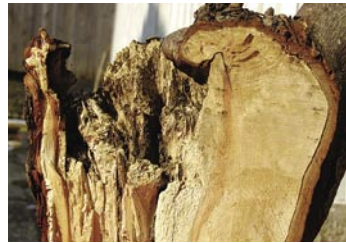
Oben: Pilze dringen in die Kappstelle ein und zerstören das Holz

In die großen Verletzungen dringen holzersetzende Pilze ein und schädigen das Holz.