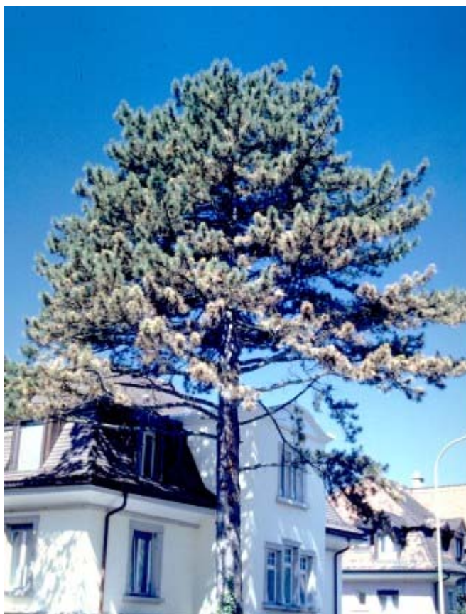
Schwarzföhren in Gartenanlagen leiden häufig unter dem Sphaeropsis -Triebsterben.

Gewöhnlich führt diese Krankheit nur bei Schwarzföhren, insbesondere im Stadtbereich, zu Ausfällen. Bei anderen Föhrenarten scheinen die