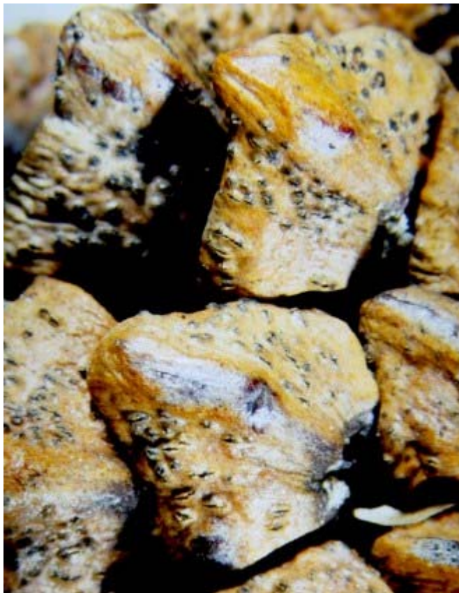
Fruchtkörper befinden sich auch auf den Zapfenschuppen.

Roland Engesser, letzte Änderung 07-APR-03 © 2003-2007 WSL - Waldschutz Schweiz email: Waldschutz Schweiz