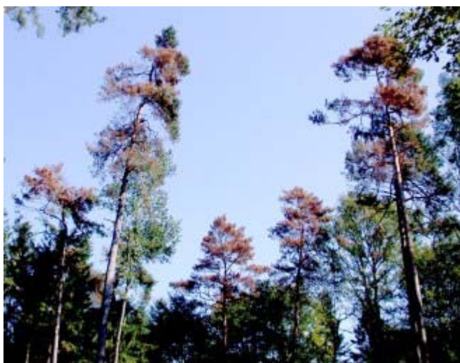
Via Hagelverletzungen werden auch weniger anfällige Berg- und Waldföhren stark infiziert.